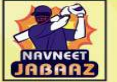
જસવીન નાગડા (ભોજાય)