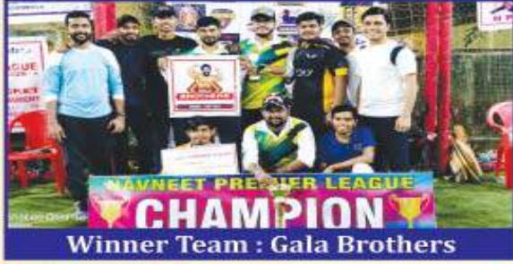
Winner Team : Gala Brothers