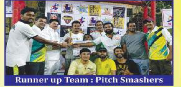
Runner up Team : Pitch Smashers