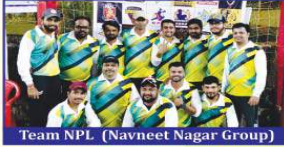
Team NPL (Navneet Nagar Group)